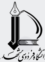
دانشگاه فردوسی مشهد