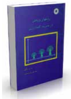
روشهای پژوهش در مدیریت کشاورزی تألیف و. ی. ینگ ترجمه مهدی خسروشاهین چاپ اول ۱۳۶۸ صفحه ۳۱۶