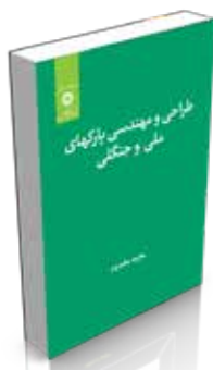
طراحی و مهندسی پارکهای ملی و جنگلی تألیف مجید مخدوم چاپ اول ۱۳۹۰ صفحه ۱۲۸