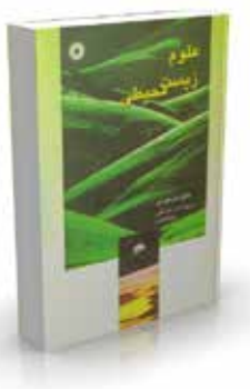
علوم زیست محیطی ویراست چهارم تألیف دانیل دی. چیراس ترجمه محمد رضا داهی، بهرام معلمی چاپ اول ۱۳۸۲ صفحه ۸۴۸