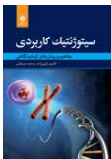
سیتوژنتیک کاربردی مفاهیم و روش‌های آزمایشگاهی تألیف قاسم کریمزاده، وحید صیادی چاپ اول ۱۳۹۸ صفحه ۳۶۸