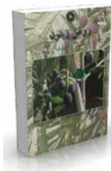
روغن زیتون (شیمی و فناوری) تألیف دیمیتریوس بوسکو ترجمه فرشته مالک چاپ اول ۱۳۸۵ صفحه ۲۰۸