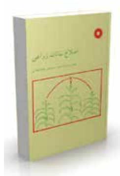
اصلاح نباتات زراعی تألیف بهمن یزدی صمدی، سیروس عبدمیثانی چاپ اول ۱۳۷۰ چاپ ششم ۱۳۸۶ صفحه ۲۹۲