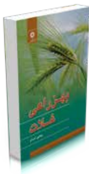
بهرزراعی غلات تألیف یحیی امام چاپ اول ۱۳۹۲ صفحه ۱۹۸