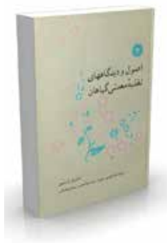
اصول و دیدگاههای تغذیه معدنی گیاهان تألیف امانوئل ایستین ترجمه غلامحسین حق نیا، سیدعبدالحسین ریاضی همدانی چاپ اول ۱۳۶۸ صفحه ۴۱۶