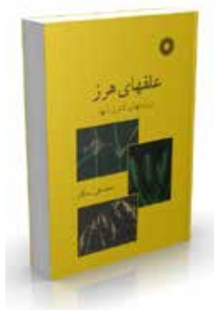
علف‌های هرز و روشهای کنترل آنها تألیف محمدعلی رستگار چاپ اول ۱۳۷۵ چاپ پنجم ۱۳۹۲ صفحه ۴۲۰