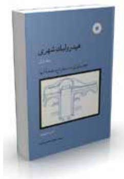
هیدرولیک شهری جلد اول هیدرولوژی - استخراج و تصفیه آبها تألیف آندره دوپون ترجمه محمد محمدی فتیده چاپ اول ۱۳۷۰ صفحه ۲۶۴