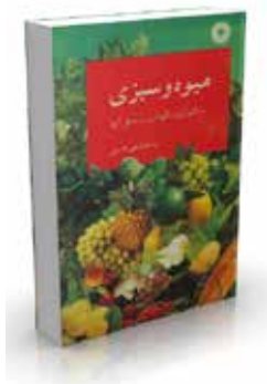
میوه و سبزی و تکنولوژی و نگهداری و تبدیل آنها تألیف رستم فرجی هارمی با تجدید نظر کامل چاپ دوم ۱۳۷۴ صفحه ۲۶۸