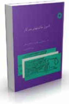
اصول ماشینهای بذرکار تألیف ه. برناتسکی، ی. هامان، زی. کانافویسکی ترجمه اکبر صناعی چاپ اول ۱۳۷۱ صفحه ۱۸۰