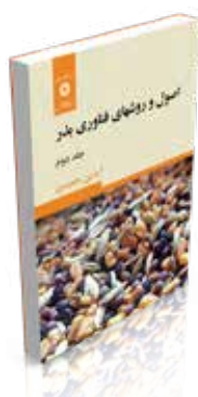
اصول و روشهای فناوری بذر جلد اول تألیف آیدین حمیدی چاپ اول ۱۳۹۶ صفحه ۴۴۴