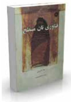
فناوری نان مسطح تألیف جلال قارونی ترجمه عبدالحسن بصیره چاپ اول ۱۳۸۲ صفحه ۱۷۶