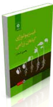
فیزیولوژی گیاهان زراعی تألیف یحیی امام، کبری مقصودی، پرویز احسانزاده چاپ اول ۱۳۹۶ صفحه ۳۰۴