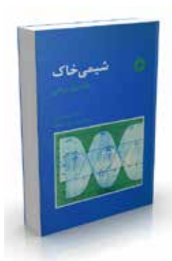
شیمی خاک جلد اول: مبانی تألیف بولت، بروگنورت ترجمه نجف‌علی کریمیان چاپ اول ۱۳۷۱ صفحه ۳۰۸