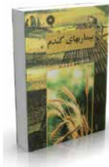
راهنمای بیماریهای گندم ویراست دوم ویراستار انگلیسی: م. و. وایز ترجمه محبوبه شاهچراغی، محمود معصومی چاپ اول ۱۳۷۶ صفحه ۴۱۶