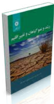
رشد و نمو گیاهان و تغییر اقلیم تألیف محمد بنیان اول، احسان نعمت الهی، حمید مقدم چاپ اول ۱۳۹۱ صفحه ۲۷۶