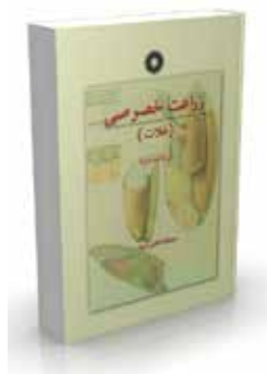
زراعت خصوصی جلد اول: (غلات) تألیف حمدالله کاظمی اربط چاپ اول، ویراست اول ۱۳۷۴ چاپ اول، ویراست دوم ۱۳۸۸ صفحه ۴۲۸