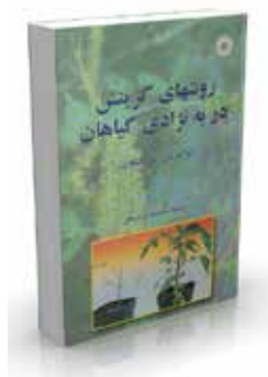
روشهای گزینش در به‌نژادی گیاهان تألیف ایزاک باس، پیتر کالیگاری ترجمه محمدمهدی سوهانی چاپ اول ۱۳۸۲ صفحه ۴۵۶