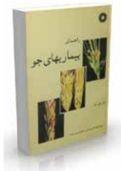
راهنمای بیماریهای جو ویراستار انگلیسی: دی. ای. ماتر ترجمه کمال الدین امامی، جهانشاه حسنزاده چاپ اول ۱۳۷۳ صفحه ۲۹۶