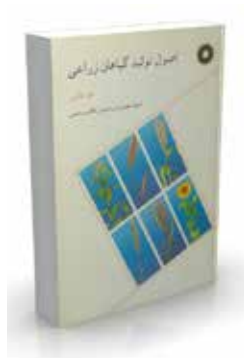
اصول تولید گیاهان زراعی تألیف ف. هارپر ترجمه بهمن یزدی صمدی، کاظم پوستینی چاپ اول ۱۳۷۳ صفحه ۳۰۴