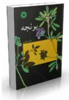
یونجه تألیف هادی کریمی چاپ اول ۱۳۶۹ چاپ دوم ۱۳۸۱ صفحه ۳۷۶