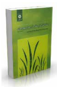
علف‌کش‌ها و علف‌های هرز مهم ایران ویراست سوم اسکندرزند، محمدعلی باغستانی، نوشین نظام‌آبادی، پرویز شیمی چاپ اول ۱۳۸۹ چاپ دوم ۱۳۹۰ صفحه ۱۵۲