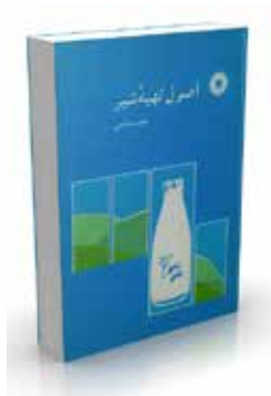
اصول تهیه شیر تألیف مجید حکمتی چاپ اول ۱۳۷۰ صفحه ۲۲۸