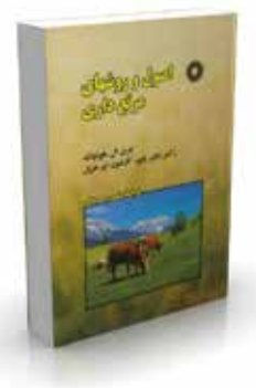
اصول و روشهای مرتع داری ویراست پنجم تألیف جری ال. هولچک، رکس دی. پاپیر، کارلتون اچ. هربل ترجمه منصور مصداقی چاپ اول ۱۳۸۸ صفحه ۷۴۸