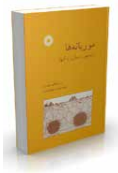
موربانه‌ها تشخیص و مبارزه با آنها ویراست دوم تألیف و. ویکتور هریس ترجمه ابراهیم سلیمان‌زادیان چاپ اول ۱۳۷۰ صفحه ۲۷۲